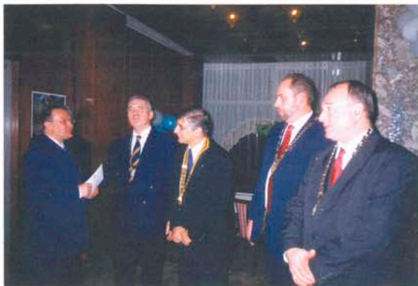
Президентите посрещат гостите на бала

Над 400-те членове и гости бяха впечатлени от уменията на незрящите юноши, показани по време на малкото спорно шоу и се убедиха, че събраните на бала средства ще бъдат използвани за едно наистина полезно дело. Освен от кувертите, средствата бяха събрани и от провеждания аукцион на картини от известни български художници, организиран съвместно с галерия „Маестро“, както и от даренията на спомоществателите на Ротари тази вечер: „Меридиан 22“, „Елана холдинг“ и „Трансекспрес“. С възторг присъстващите посрещнаха информацията, че Ротари клубове от Израел, членуващи в Българо-израелския комитет, създаден по инициатива на бъдещия дистрикт-гуверньор на Д-2480 Калчо Хинов (вторият българин гуверньор на дистрикт след Любен Божков през 1940 г.) са одобрили сумата от 6000 долара за децата в неравностойно положение в България. Над 500 паунда са изпратени и от РК в Бартон ле Клей, Великобритания, с който РК -