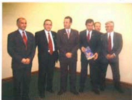
С Борда на РК Пловдив-Пълдин