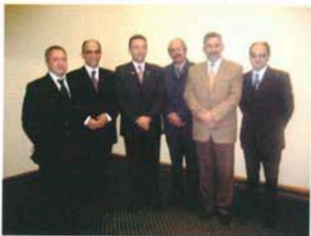
С Борда на РК Асеновград