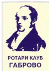
РОТАРИ КЛУБ ГАБРОВО

РК - Севлиево , също нов клуб, но с новаторски идеи. Особено ми хареса организирания от тях конкурс по рисуване за младежи и присъжданата на победителите парична награда. Клубните членове са активни и успешни бизнесмени, готови да служат на хората.